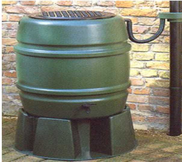
Figura 1. Cisterna locale