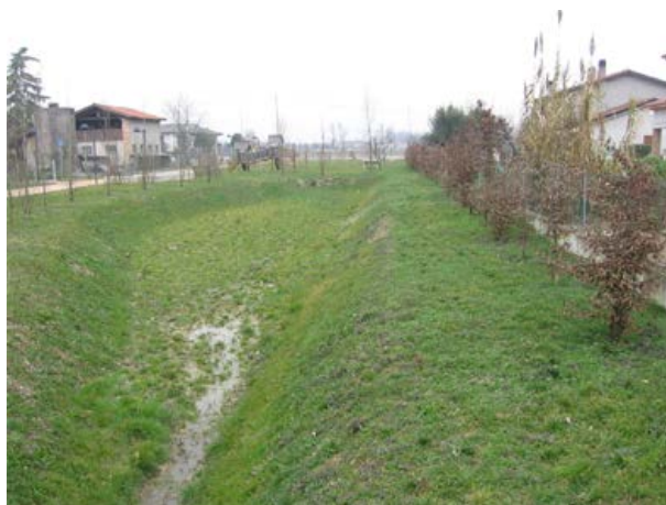
Figura 2. Bacini infiltrazione