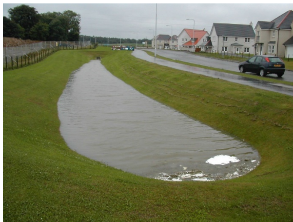
Figura 3. Bacino di detenzione

Un'altra tecnica utilizzare per minimizzare l'apporto di acqua meteorica alle reti di deflusso, è quella di diminuire i coefficienti di afflusso delle aree di nuova urbanizzazione utilizzando, ove possibile, pavimentazioni di tipo drenante.