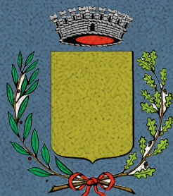
Comune di Campodoro