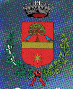
Comune di Piombino Dese