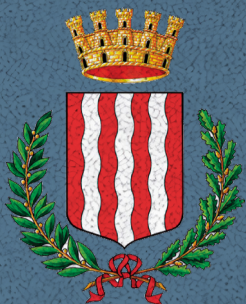
Città di Campodarsego