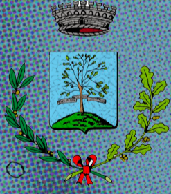
Comune di Tombolo