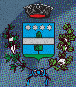
Comune di Gazzo Padovano