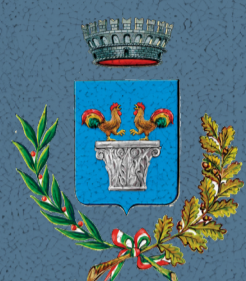
Comune di Galliera Veneta