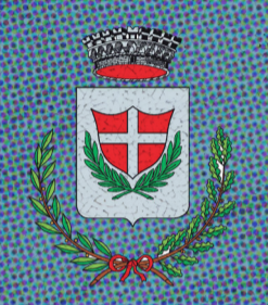
Comune di Grantorto