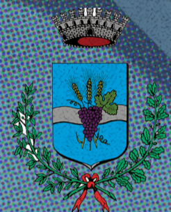
Comune di Loreggia