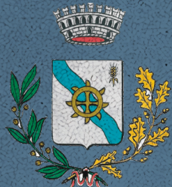
Comune di Campo San Martino