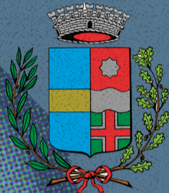
Comune di Massanzago