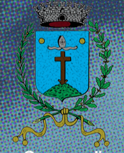
Comune di San Giorgio delle Pertiche