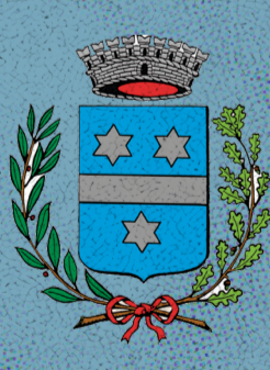
Comune di Villanova di Camposampiero