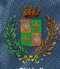
Città di Piazzola sul Brenta