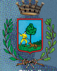
Città di San Martino di Lupari