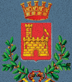
Città di Cittadella