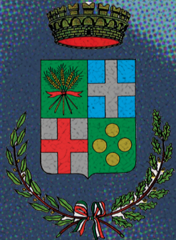
Comune di Villa del Conte