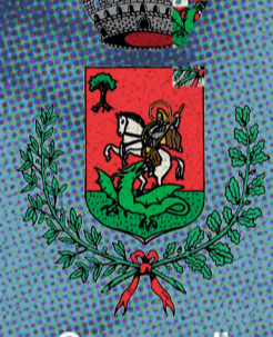
Comune di San Giorgio in Bosco