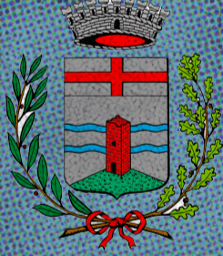
Comune di Santa Giustina in Colle