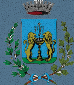
Comune di Fontaniva