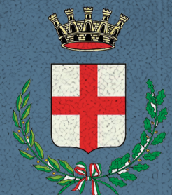
Città di Camposampiero