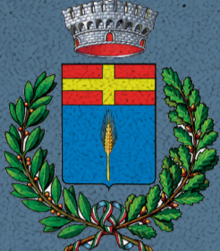
Comune di Curtarolo