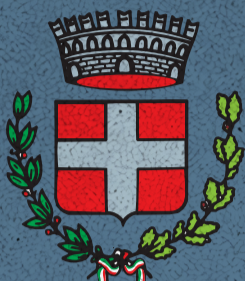
Comune di Carmignano di Brenta