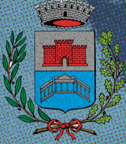
Città di Trebaseleghe