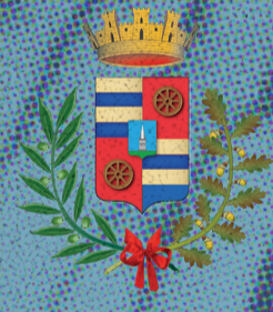
Città di Vigonza