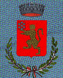
Comune di Limena