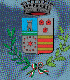
Comune di Vigodarzere