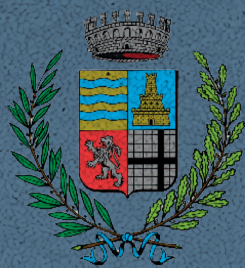
Comune di Borgoricco