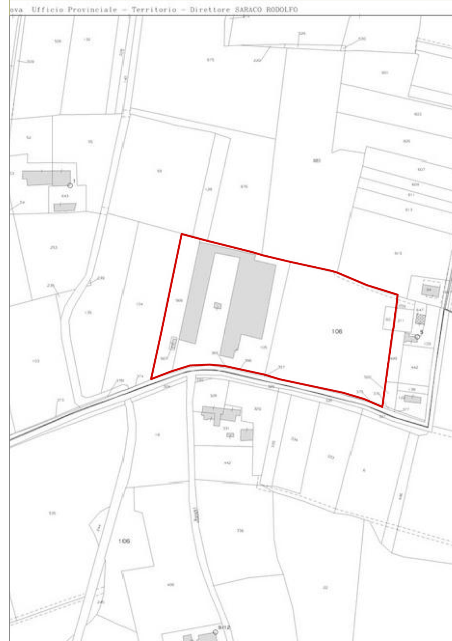
ESTRATTO CATASTALE / scala 1:2000