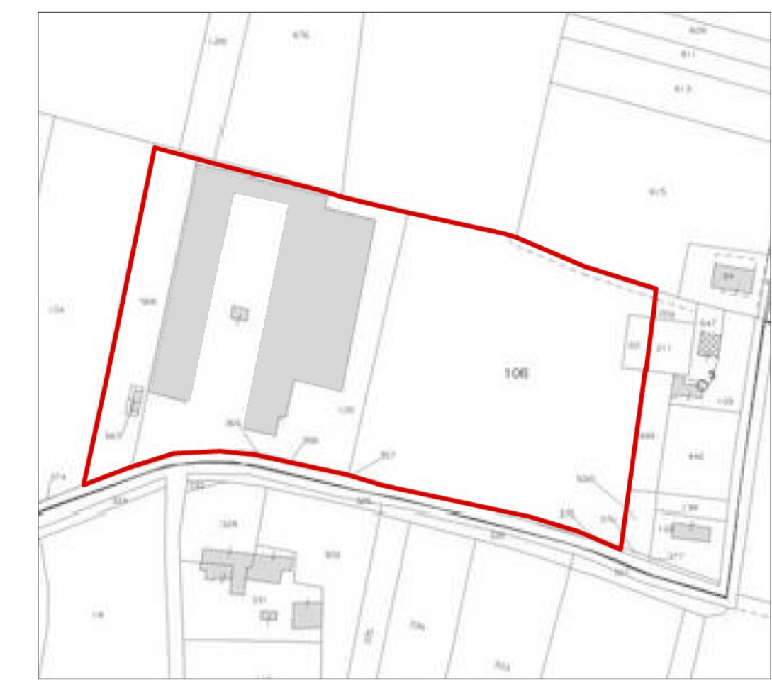
PLANIMETRIA STATO DI FATTO / scala 1:2000