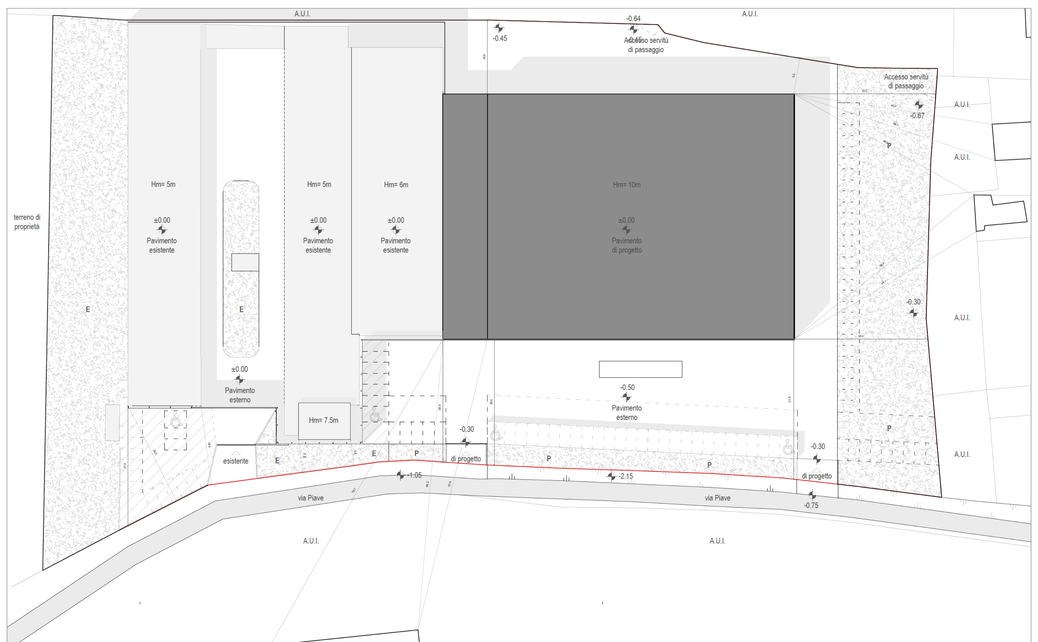
PLANIMETRIA DI PROGETTO / scala 1:500