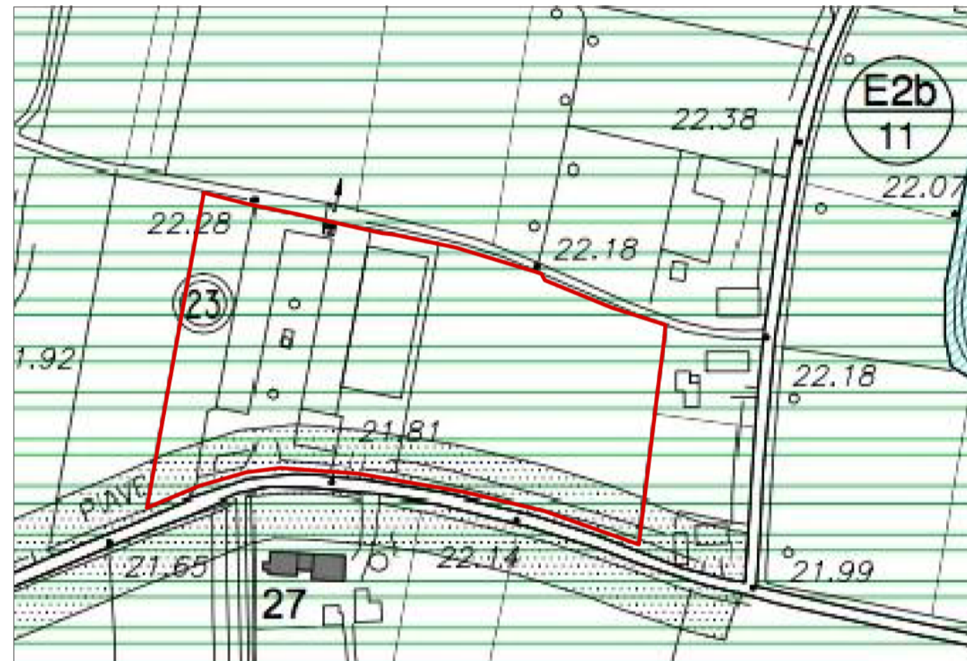
ESTRATTO PRG AREA DI INTERVENTO / Fuori scala